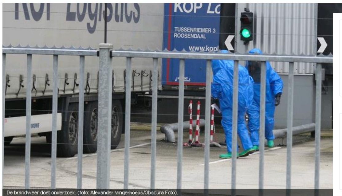
De brandweer doet onderzoek.

WEST | MIDDEN | NOORDOOST | ZUIDOOST | SPORT | 112 | ECONOMIE | SHOW | NI